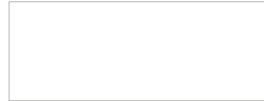
U11027 XT / XG (U1027 / W1027) 18 / 19 mm Ijswit