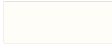
U11026 XT / XG (U1026) 18 / 19 mm Kristalwit