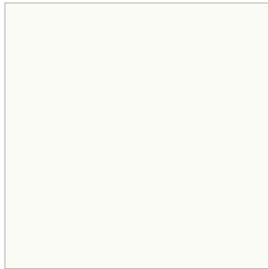
U11102 XT (W00102) 18 / 19 mm Chalk