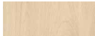
R24029 XT (R5829) 19 mm Fjord beuken licht